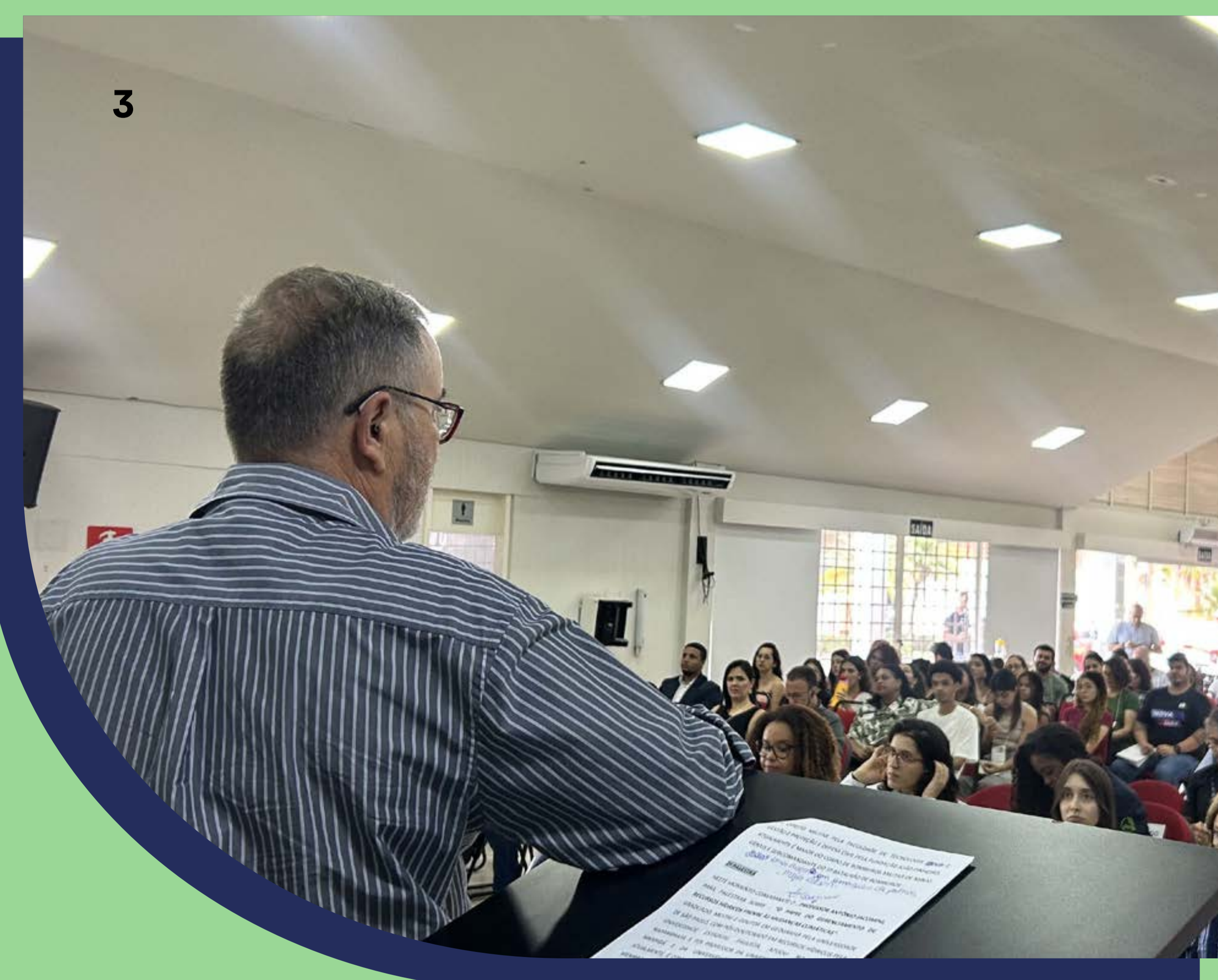
Foto 5 - Autoridades durante abertura oficial do Seminário